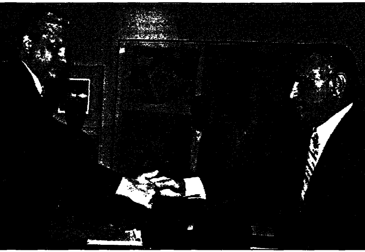
وزير الدفاع الإسرائيلي إيهود باراك يشرح لوزير الخارجية الإسرائيلي شيمون بيريز (يسار) موقفه من المفاوضات مع الفلسطينيين.

القدس - من جان لوك ونوفدي وديانيل ستيرنوف: